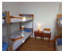
Capacité d'accueil : 7 à 14 personnes, selon l'occupation des couchages