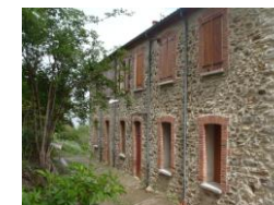
Gîtes Ancienne Ecole