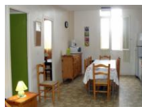
N° 4 - A l'étage côté cour, plain-pied côté entrée, 6 à 7 personnes.

Entrée couloir avec placards. Pièce commune avec coin cuisine-repas et coin salon avec clic-clac. 1° chambre 1 lit en 140. 2° chambre avec 2 lits en 80. Salle d'eau avec douche, lavabo et toilettes.