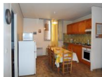
N° 3 - Rez-de-chaussée, 4 à 5 personnes.

Accès jusqu'à la cour du bâtiment avec véhicule. Possibilité de stationnement sur place. Escalier extérieur pour atteindre le premier niveau.