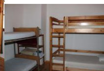
Capacité d'accueil : 7 à 14 personnes, selon l'occupation des couchages

Pièce commune à l'entrée. 1° chambre, 4 couchages simples superposés, 2° chambre, 6 couchages simples superposés, 3° chambre, 2 couchages simples et 1 double couchage en mezzanine.