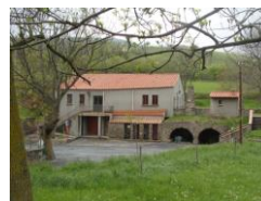
Location Salle Polyvalente