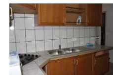
Pièce commune, coin cuisine

Pièce commune à l'entrée. 1° chambre, 4 couchages simples superposés, 2° chambre, 6 couchages simples superposés, 3° chambre, 2 couchages simples et 1 double couchage en mezzanine.