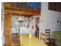
N° 2 - A l'étage, 6 à 7 personnes.

Pièce commune cuisine-repas avec 1 clic-clac. 1° Chambre 1 lit en 140. 2° Chambre 2 lits en 80 superposés + 1 lit en 140. Salle d'eau avec douche, lavabo, toilettes.