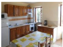
N° 1 BIS – RDC, 4 personnes.

Pièce commune en « L », avec une sortie terrasse couverte, comportant un coin cuisine, un coin salon-repas avec clic-clac. Une chambre 1 lit en 140. Salle d'eau avec douche, lavabo et toilettes. Mezzanine à l'étage, 2 chambres fermées avec 1 lit en 140 dans l'une et 2 lits en 90 dans l'autre.