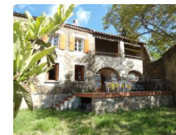
Gîtes Ancien Presbytère