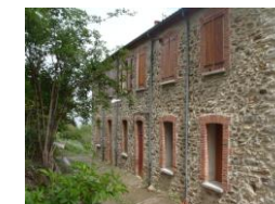
Gîtes Ancienne Ecole

CONTACT TÉLÉPHONIQUE Renseignements - Réservations - Contrats Au domicile de M. le maire : 04.68.35.05.47