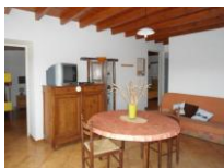
N° 1 - A l'étage, 4 à 5 personnes.

Accès piétonnier, possibilité de stationner les véhicules sur la place publique (à 30 m. env.), le temps de décharger. Parking à l'entrée du village.